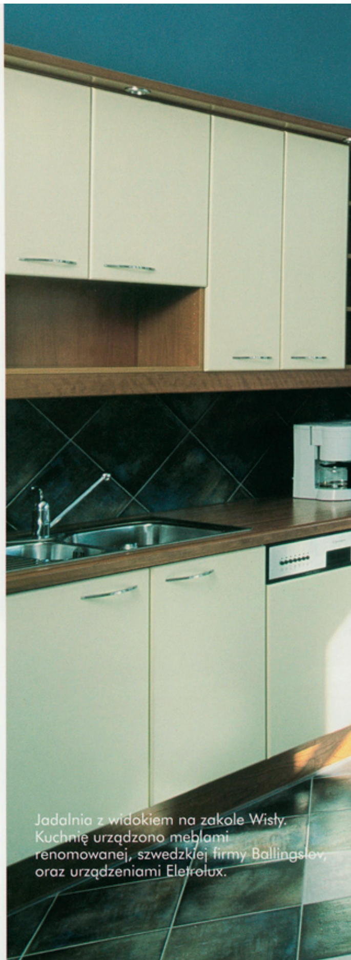
Jadalnia z widokiem na zakole Wisły. Kuchnię urządzono meblami renomowanej, szwedzkiej firmy Ballingslev, oraz urządzeniami Elettrolux.

Kamienica, jak wszystkie budynki apartamentowe, ma doskonałe parametry termoizolacyjne. Zastosowanie luksusowej stolarki okiennej z podwyższonymi parametrami dźwiękoszczelności (od ulicy) sprawia, że choć budynek znajduje się przy ruchliwym trakcie z tramwajem, w środku panuje idealna cisza.